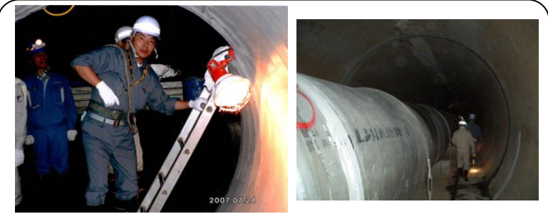
岳南排水路視察 (7/24) …日本で唯一の工業専用下水路を、工事中の地下にもぐって視察しました