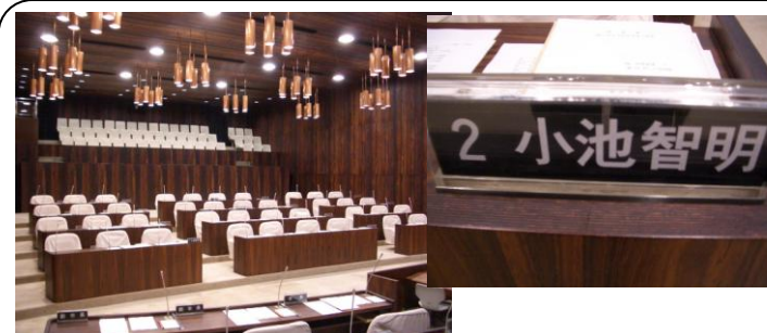
9月定例議会 (9/10～10/2) …本会議開催中は撮影できないので休憩時間に撮影。私の席は前列左から3番目です

ブログを覗いてみてください。ほぼ毎日更新しています。 http://koike473.exblog.jp/