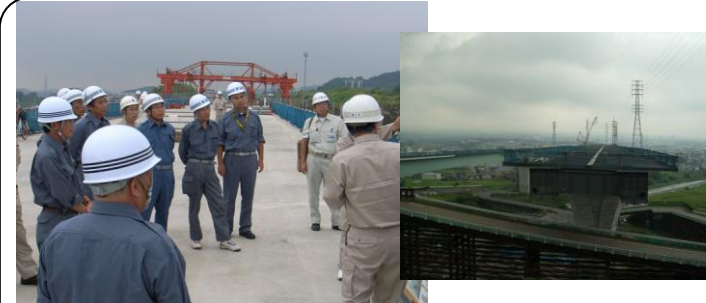
第二東名視察 (8/31) …市内ルートは、ほぼ完成形が見えつつあります。今後はいかに活用するかが課題です