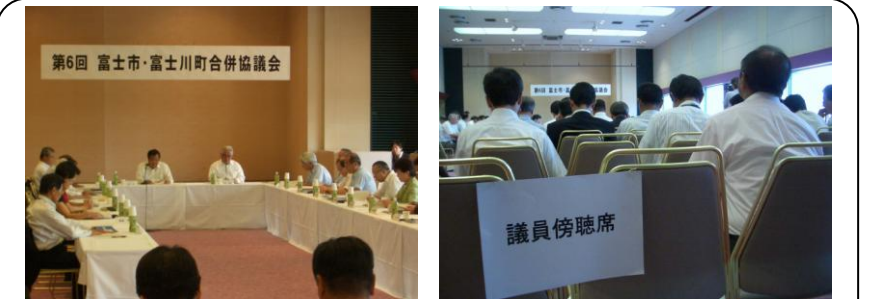
第6回 富士市・富士川町合併協議会 (7/19、8/29) …来年11月1日の合併を目標に、さまざまな面での「すり合わせ」が続きます