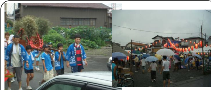
駿河台3丁目夏祭り (7/21) …台風で1週間延期になりましたが、例年以上の人出で賑わいました

7月～9月の活動 …毎日、現場に出かけ、皆さんのお話を伺いながら、勉強・活動しています！