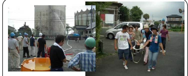
駿河台3丁目防災訓練 (9/1) …土曜日でしたが、男性の参加が少なく残念。そう言う私も久しぶりの参加でした