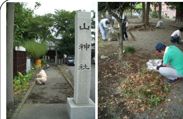
荒田島山神社清掃 (9/8) …私も氏子になっている神社です。8月から月1回の清掃が始まりました。できる限り参加したいと思います