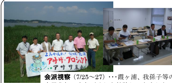
会派視察 (7/25～27) …霞ヶ浦、我孫子等の市民参加のまちづくりを勉強してきました