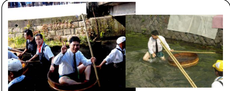
田宿川たらい流し川祭り (7/29) …今年は久しぶりにたらいに乗り、見事沈没し、大きな喝采をいただきました