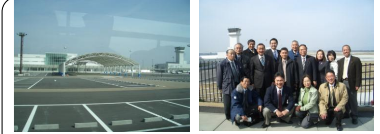
富士山静岡空港視察(2/13)…完成間近の空港を議員有志で視察しました。「立木問題」については、県と地権者との間の問題だけでなく、国の法制度や基準の矛盾も大きいと感じました。