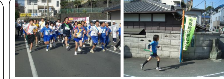
今泉駅伝(2/22)…小学生から一般(町内対抗)チームまでが参加する市内唯一の市街地を走る駅伝です。吉原二中は32チーム、約200名もが参加しました！