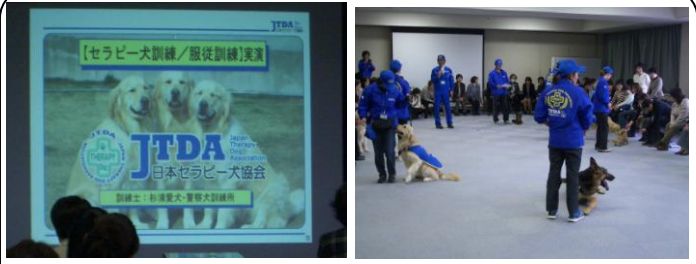
セラピー犬と医療についての講演会(3/14)…精神的な癒しや日常生活のサポート面で犬を飼う人が増えています。「ワンちゃん人間が共生できるまちづくり」が必要です！