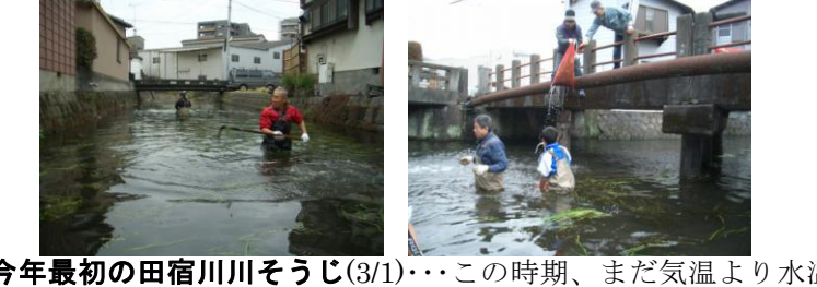
今年最初の田宿川そうじ(3/1)…この時期、まだ気温より水温(14～15℃)が高く水の中は快適です！今回から刈った水草はその場で陸に上げるようになりました。それを確実にするには、流域全体の協力と、引き上げる機械設備の必要性を感じます！