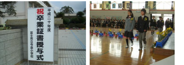
今泉小学校卒業式(3/19)…吉原二中は議会があり出席できませんでしたが、今泉小は式に間に合いました！みんな緊張していますが、中学生になっても「誓いの言葉」を忘れずガンバレ！

ブログを覗いてみてください。ほぼ毎日更新しています。 ( http://koike473.exblog.jp/ )