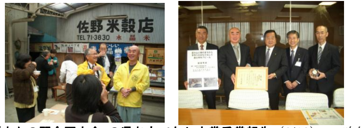
「まちの駅全国大会」の県おもてなし大賞受賞報告(3/18)…昨年11月に富士市で開催された「まちの駅全国大会」が見事おもてなし大賞を受賞しました！鈴木市長も大変喜び、駅長さん達の頑張りをたたえ、今後も市としてのバックアップを約束してくれました！