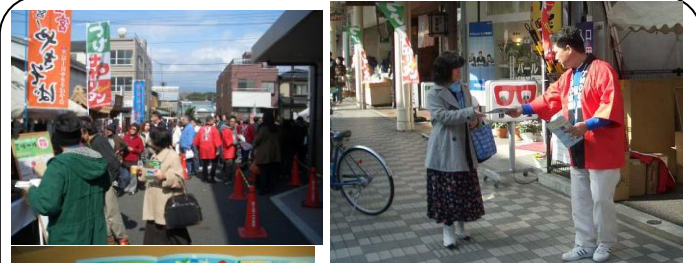
つけナポリタン大試食会(3/1)…吉原を中心にブレイクの予感の「つけナ」！私も呼び込みをやりました。「吉原」から「富士市全体」に！そして「予感」を「実感」にしていきたいと思います！