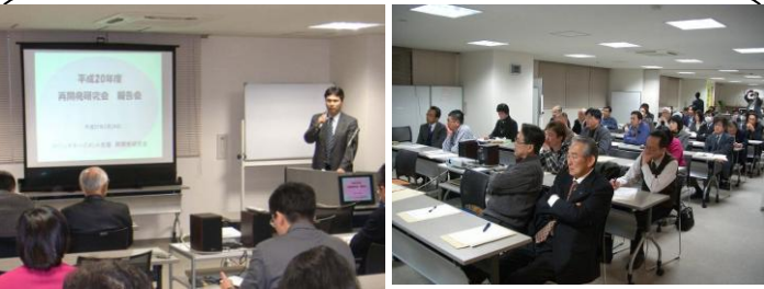
吉原再開発研究会報告会(3/24)…客離れが進み、防災上からも心配な吉原中心市街地の再生・再編を図る1つの手法として「再開発」を地域の皆さんと研究しています！私がリーダーを務める研究会の検討成果を発表しました！