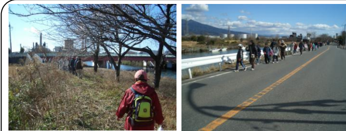
「そうだ！沼川プロジェクト」川沿いウォーキング(1/24)…滝川、沼川沿いを2グループで歩きました。一部通行できない区間もありますが、富士山の眺めがすばらしいウォーキングコースです！

…景気悪化で仕事や住居確保の不安を訴える方が増えています！市としてのセーフティネットが必要です！