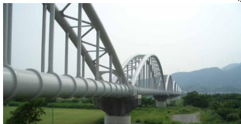
東駿河湾工業用水 富士川水管橋